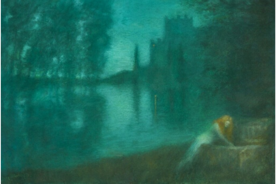
Lucien Lévy-Dhurmer: Mélisande am Brunnen Pastellzeichnung aus dem Jahr 1902

übergab er allerdings aus Zeitgründen seinem Schüler Charles Koechlin. Nach der erfolgreichen Aufführung in London stellte Fauré einige Stücke der Bühnenmusik zu einer Suite für den Konzertsaal zusammen, wobei er Koechlin's Londoner Partitur als Ausgangspunkt verwendete. Die Suite bestand zunächst aus den drei Sätzen Prélude , La Fileuse und La morte de Mélisande . Die Sicilienne fügte Fauré erst acht Jahre später zur Suite hinzu.